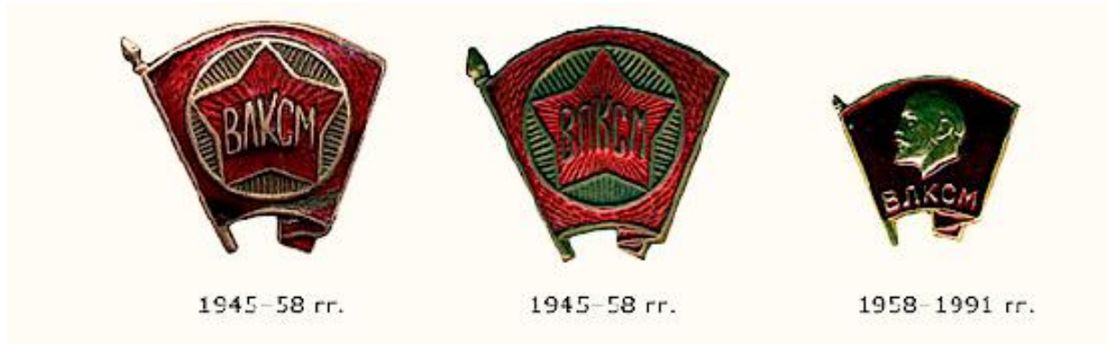
Рис. 2 Новый нагрудный значок члена ВЛКСМ

Комсомольские организации объединяли молодежь. Через комсомол осуществлялось идеологическое воспитание молодёжи и реализовались политические и социальные проекты. В комсомол вступали достойные, достигшие возраста 14 лет и старше. В 28 лет молодой человек выбывал из Союза молодёжи по возрасту.