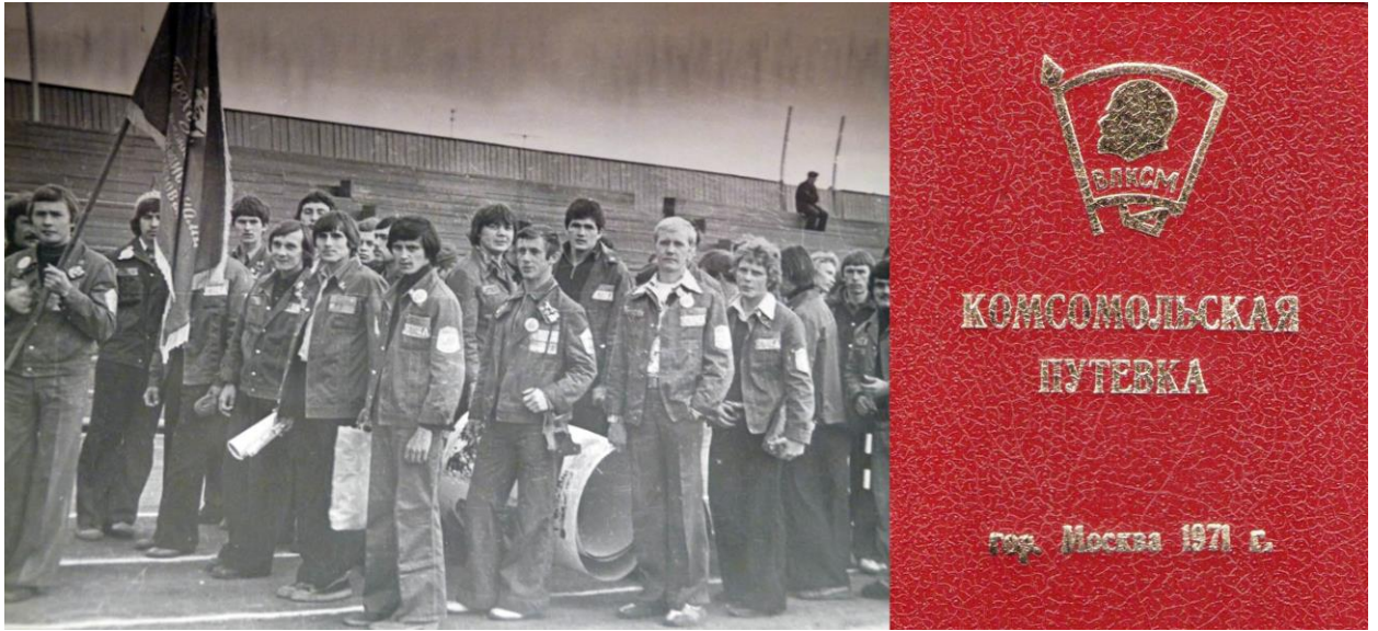
Рис. 4 Специальная форма стройотрядов