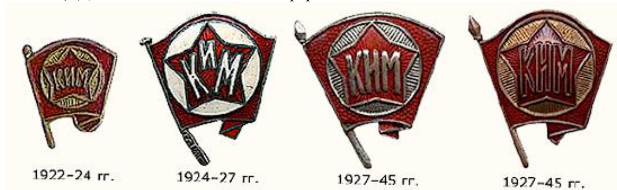
Рис. 1 Нагрудный значок члена ВЛКСМ

Надпись ВЛКСМ появилась на значках в 1945 году. Членский значок ВЛКСМ со звездой учрежден в 1945 году после распада III Коммунистического Интернационала (1943 года). До этого на аналогичном по форме знаке значилось "КИМ".