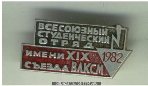
Рис. 3 Значок стройотрядовца