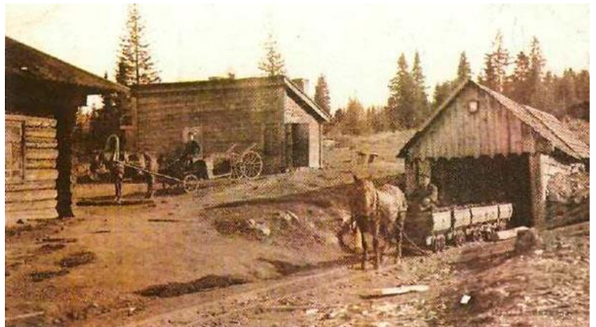
Рабочие шахт в Луньевке