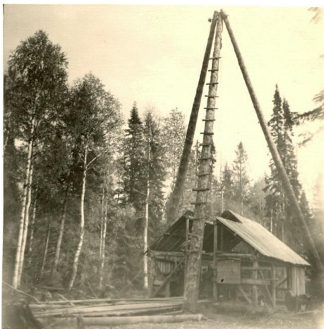
Буровая вышка в Луньевке